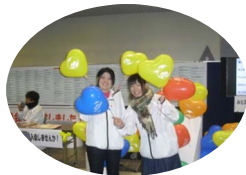
H23 年度子育て応援隊参加一覧